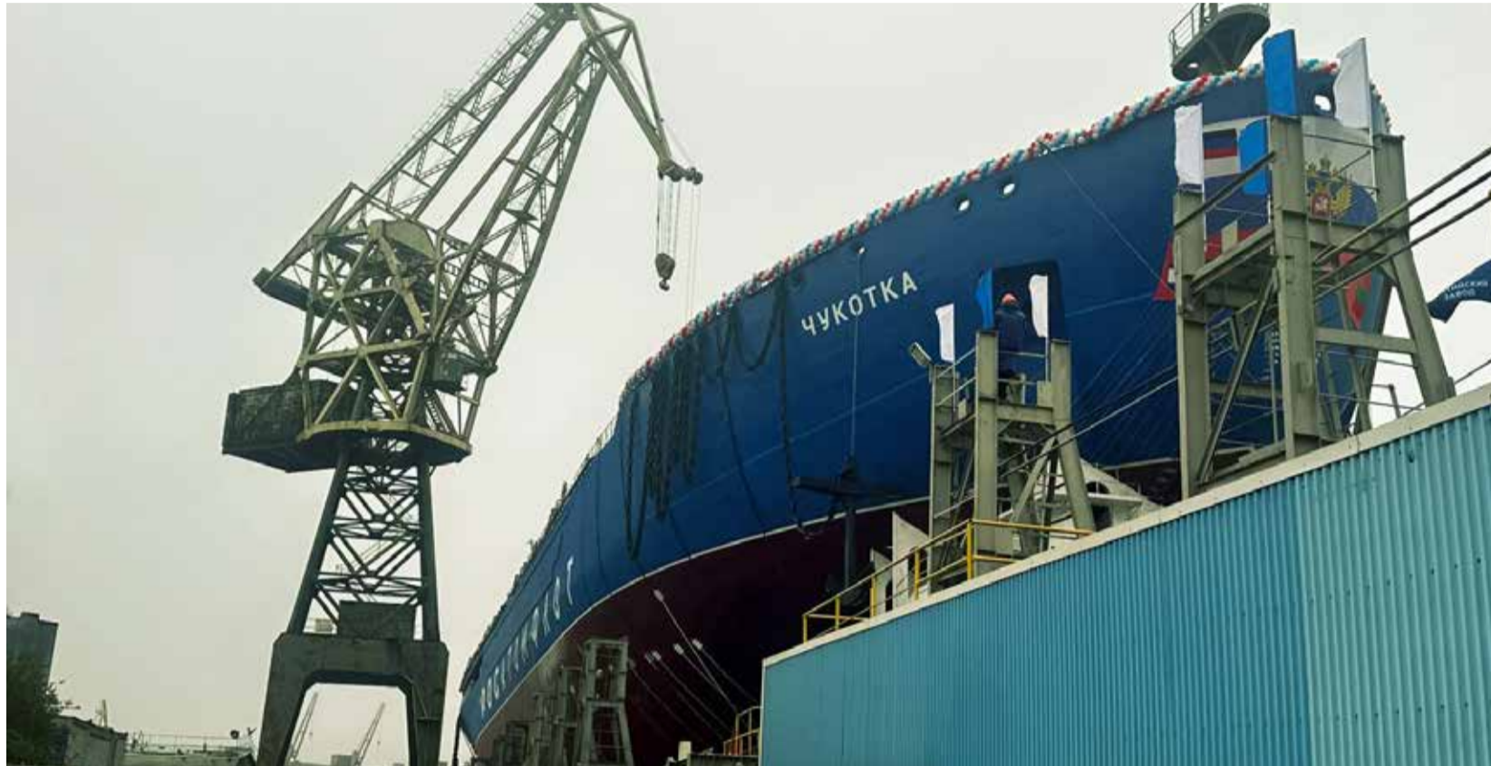
Фото «Водного транспорта»